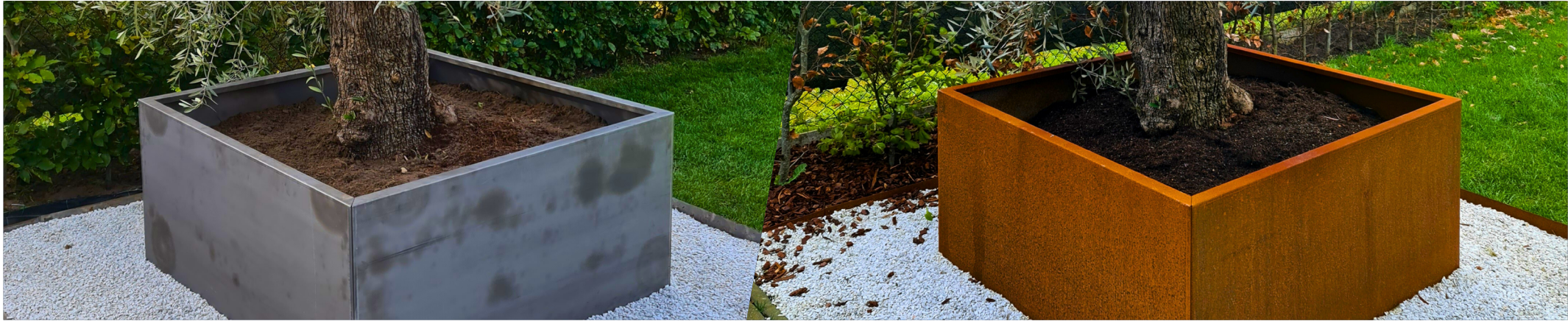
Upon delivery - unruisted